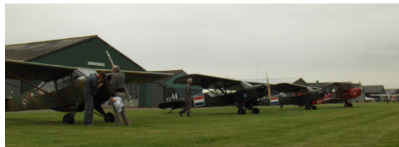
De Wings to Victory Formation lined up.