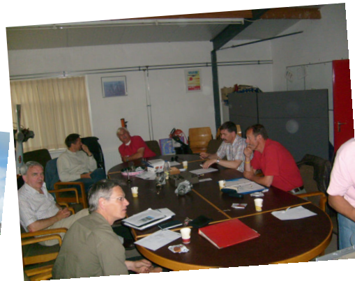
Vergaderen in de "staffroom"