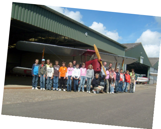
Bezoek van een school in de buurt