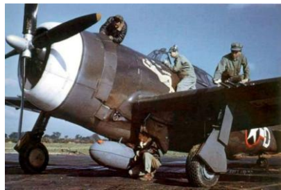
Een P47 Thunderbolt, “little friend” van de grote bommenwerpers.