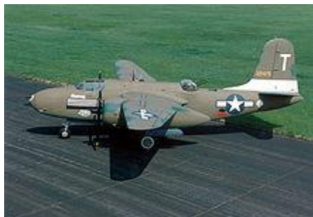
A-20G Havoc displayed at the National Museum of the U.S. Air Force.