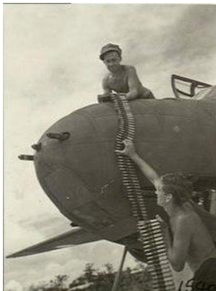
Loading .50-caliber ammunition onto a Boston of No. 22 Squadron RAAF at Noemfoor Island, Netherlands New Guinea, in August 1944.

In deel II meer over de Bostons die in Zeeland verongelukt zijn.