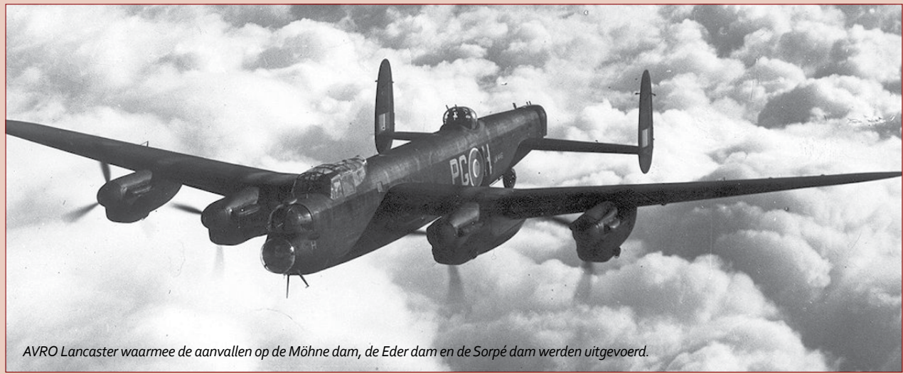
AVRO Lancaster waarmee de aanvallen op de Möhne dam, de Eder dam en de Sorpé dam werden uitgevoerd.

5. Locatie neergestorte gevechtsvliegtuig Indien u geïnteresseerd bent kunt u eventueel ook de plaats bezoeken waar Guy Gibson en James Warwick in hun De Havilland Mosquito zijn neergestort. Deze locatie ligt iets buiten het centrum op circa 15 minuten loopafstand van